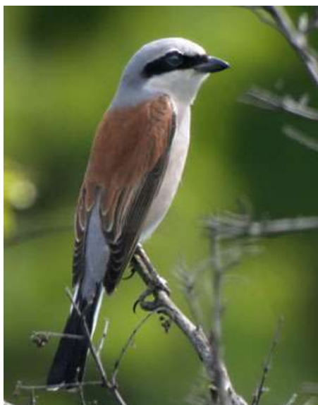
Alcaudón dorsirrojo (Lanius collurio)