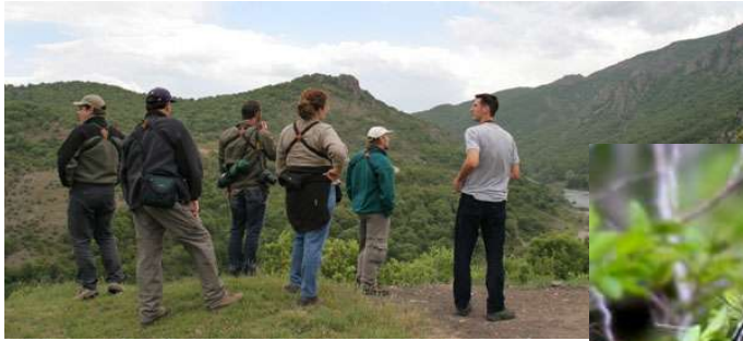
Curruca gabilana ( Sylvia nisoria )