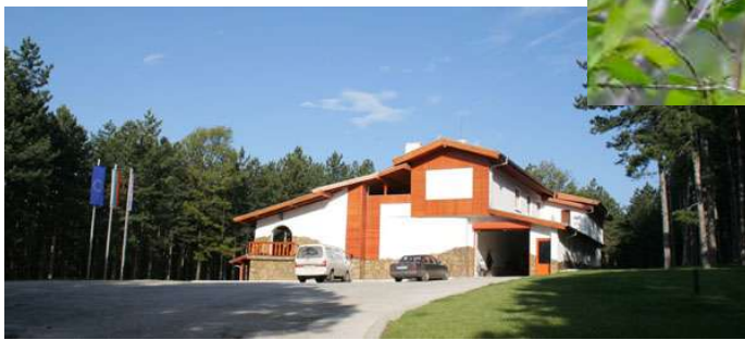
Hotel Boirana “Sakar”