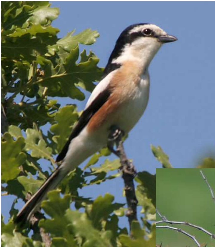
Alcaudón núbico ( Lanius nubicus )