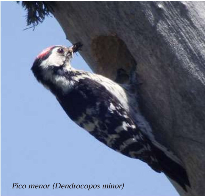
Pico menor (Dendrocopos minor)