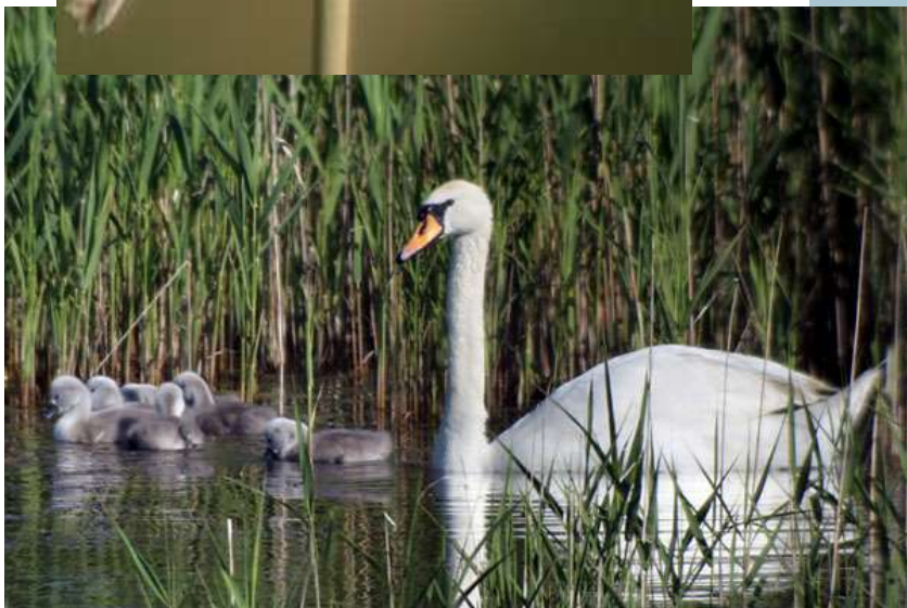
Cisne vulgar (Cygnus olor)