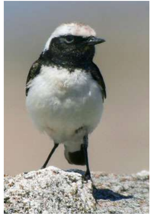
Collalba pía (Oenanthe pleschanka)