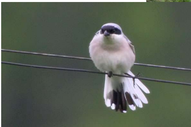
Alcaudón chico ( Lanius minor )