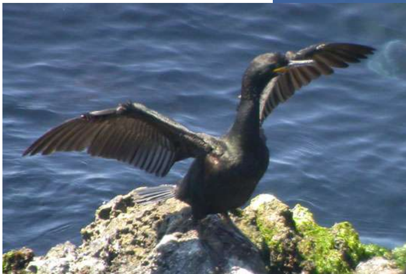
Cormorán moñudo (Phalacrocorax aristotelis)