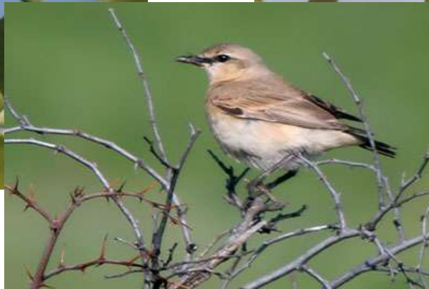
Collalba isabel ( Oenanthe isabellina )