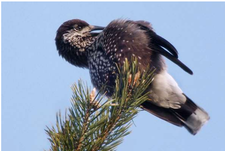
Cascanueces ( Nucifraga caryocatactes )

Observación de aves en el complejo Maljovitsa, cerca de Govedartsi. Viaje ruta a Kardjali, observación de aves en Lozen y en las montañas cercanas a Topolovo.