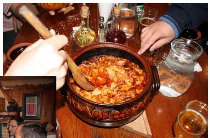
Cena con comida típica del país... EXQUISITA!!!!