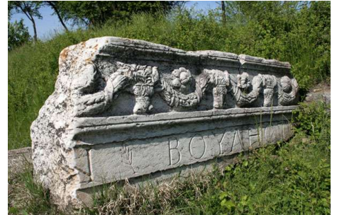
Nikolasi Ad Istrum