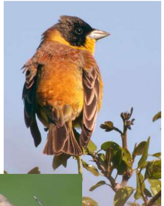
Escribano cabecinegro ( Emberiza melanocephala )