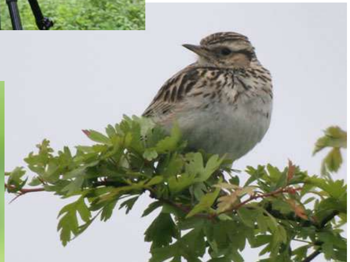
Totovía ( Lullula arborea )