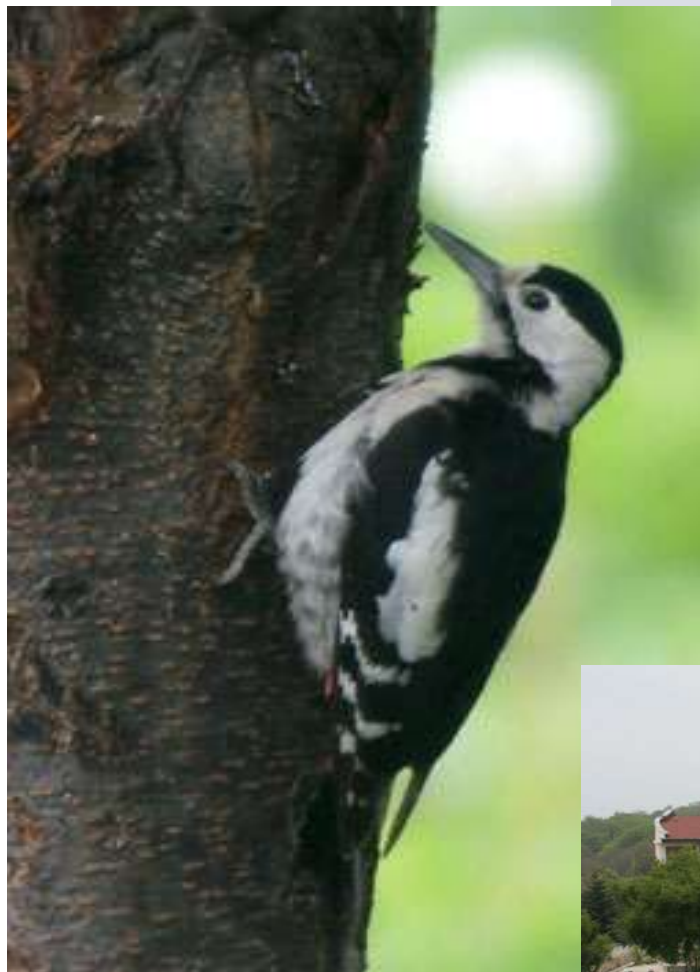
Pico sirio ( Dendrocopos syriacus )