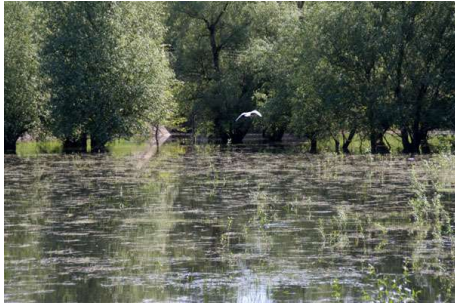
Orillas del Danubio

Viaje ruta a Beli Osam, visitas a la reserva de Srebarna en las orillas del Danubio, a la antigua capital de Bulgaria, Veliko Tarnovo y a las ruinas de la ciudad romana Nikolasi Ad Istrum.