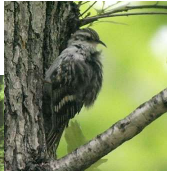
Agateador común ( Certhia brachydactyla )