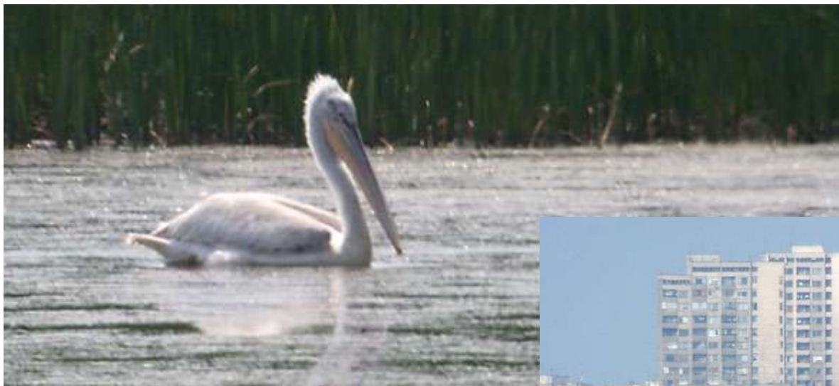
Pelícano ceñudo (Pelecanus crispus)